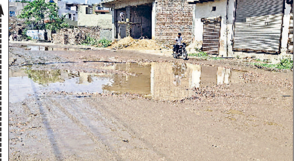
झज्जर। अग्रसेन चौक के नजदीक बने गहरे गड्ढे में हुआ जलभराव।