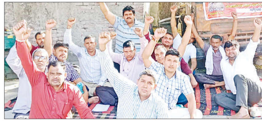
बहादुरगढ़। दमकल केंद्र में धरने पर बैठे कर्मचारी।

फरीदाबाद के हादसे में जान गंवाने वाले दो कर्मचारियों को मिले शहीद का दर्जा