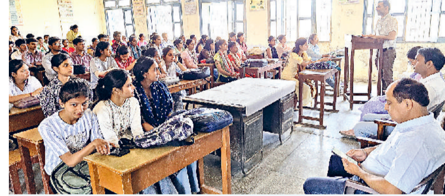
झज्जर। कार्यक्रम के दौरान उपस्थित विद्यार्थियों को संबोधित करते हुए विषय विशेषज्ञ।