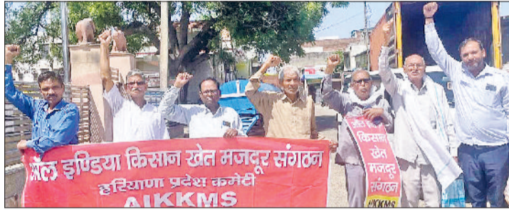
बहादुरगढ़। अनाज मंडी में नारेबाजी करते किसान संगठन के सदस्य।