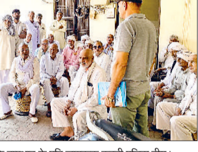
झज्जर। आमजन को नशे के दुष्प्रभाव के प्रति जागरूक करती पुलिस टीम।