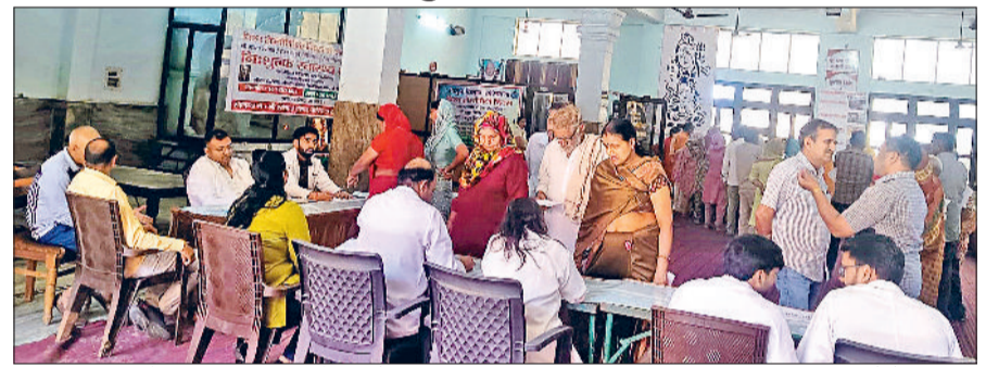
झज्जर। शिविर में स्वास्थ्य जांच करावते हुए लोग।