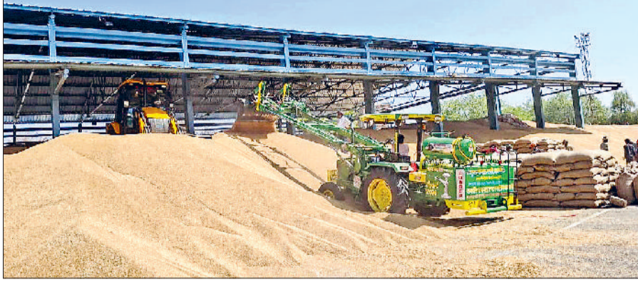
झज्जर। जेसीबी की सहायता से गेहूं को ऊपर उठाते हुए चालक।