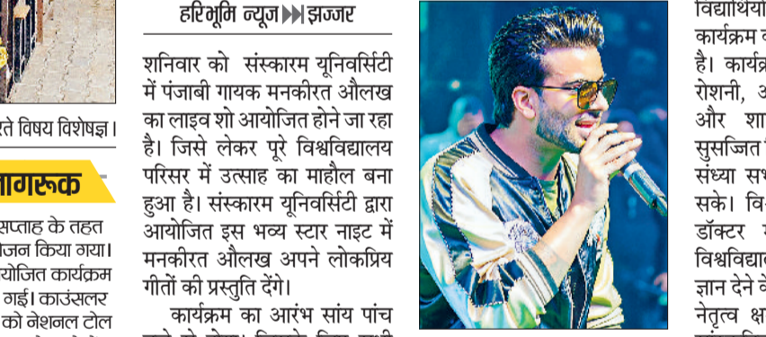
झज्जर। मनकीरत औलख, पंजाबी सिंगर।

शनिवार को संस्कारम यूनिवर्सिटी में पंजाबी गायक मनकीरत औलख का लाइव शो आयोजित होने जा रहा है। जिसे लेकर पूरे विश्वविद्यालय परिसर में उत्साह का माहौल बना हुआ है। संस्कारम यूनिवर्सिटी द्वारा आयोजित इस भव्य स्टार नाइट में मनकीरत औलख अपने लोकप्रिय गीतों की प्रस्तुति देंगे। कार्यक्रम का आरंभ सायं पांच बजे से होगा। जिसके लिए सभी तैयारियां पूरी कर ली गई हैं। संस्कारम यूनिवर्सिटी द्वारा आयोजित यह कार्यक्रम विद्यार्थियों के लिए मनोरंजन का बेहद अच्छा माध्यम बनेगा। विश्वविद्यालय निरंतर ऐसे आयोजनों के माध्यम से छात्रों