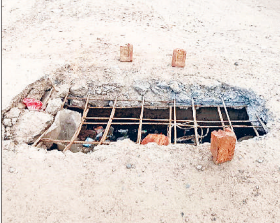
बहादुरगढ़। ओमेक्स सिटी में क्षतिग्रस्त हुआ नाला।