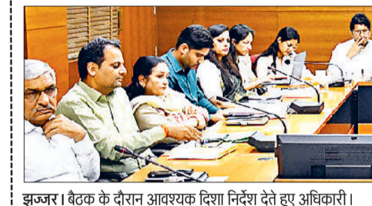
झज्जर। बैठक के दौरान आवश्यक दिशा निर्देश देते हुए अधिकारी।